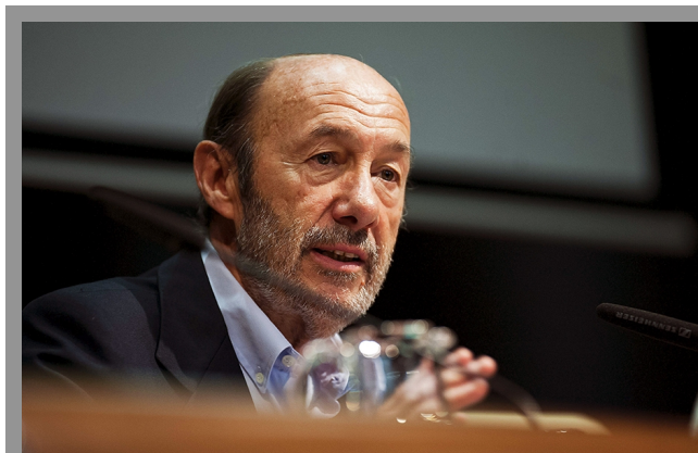
El ex secretario general del PSOE, Alfredo Pérez Rubalcaba

El ex secretario general del PSOE Alfredo Pérez Rubalcaba echó mano ayer de términos científicos, en su condición de profesor de Química Orgánica de la Universidad Complutense, y aseguró que hay "políticos hiperreactivos, que hablan todo el tiempo y son una auténtica peste". Pérez Rubalcaba, que no hizo declaraciones a los periodistas, ofreció la conferencia "Química y Política" con motivo de la celebración del Día de la