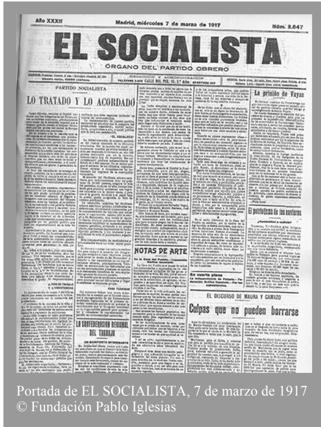
Portada de EL SOCIALISTA, 7 de marzo de 1917